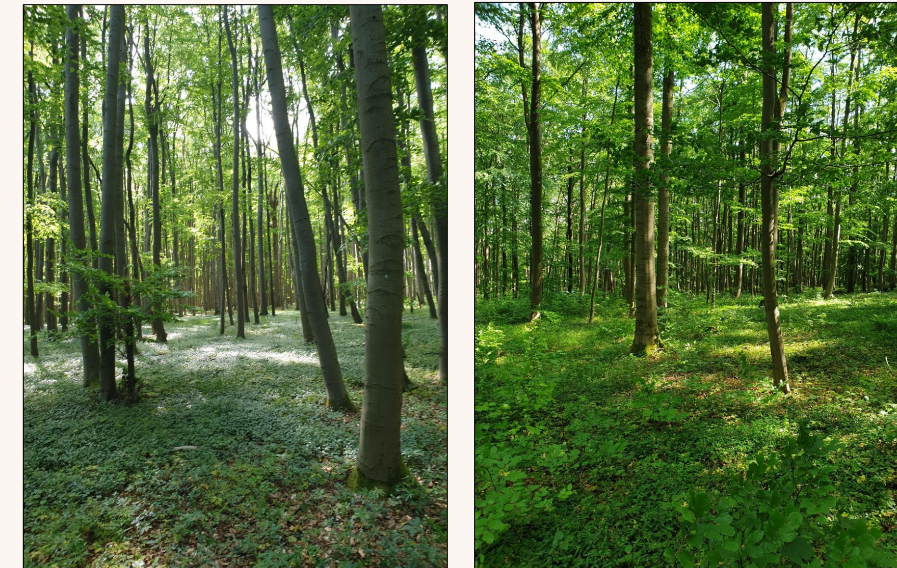
Naturwaldreservat (links) und Vergleichsfläche (rechts) Hohenstein

— Lufttemperatur 15 cm über Boden — Temperatur in der Laubstreu 2 cm über Boden — Bodentemperatur u. Bodenfeuchte 6 cm im Boden