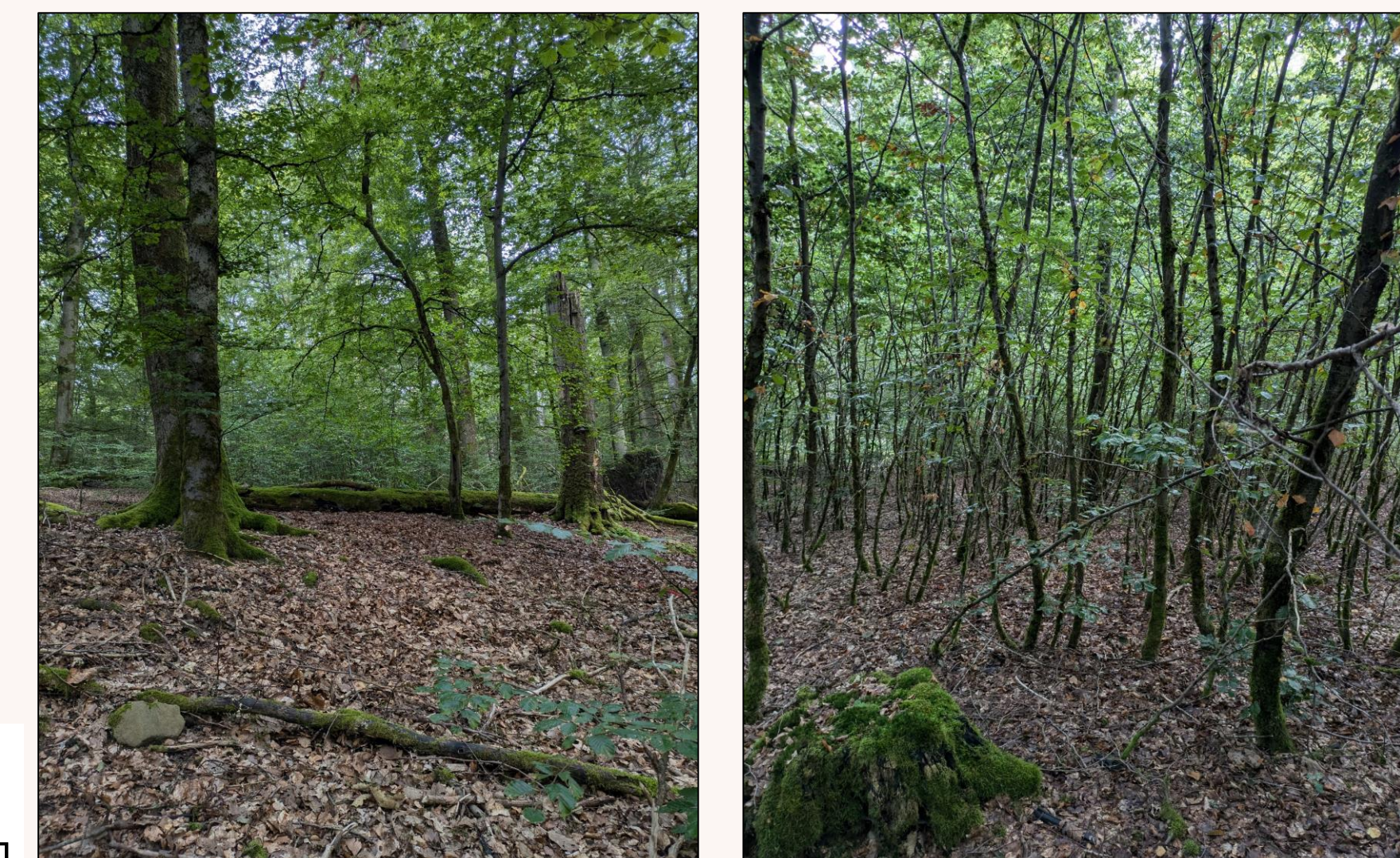
Naturwaldreservat (links) und Vergleichsfläche (rechts) Hasenblick