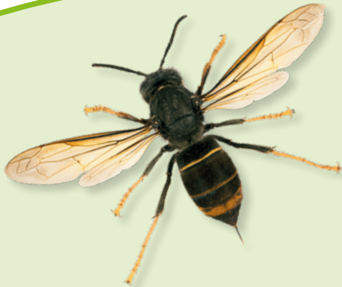
Asiatische Hornisse

Helfen Sie mit, die Europäische Hornisse zu schützen!