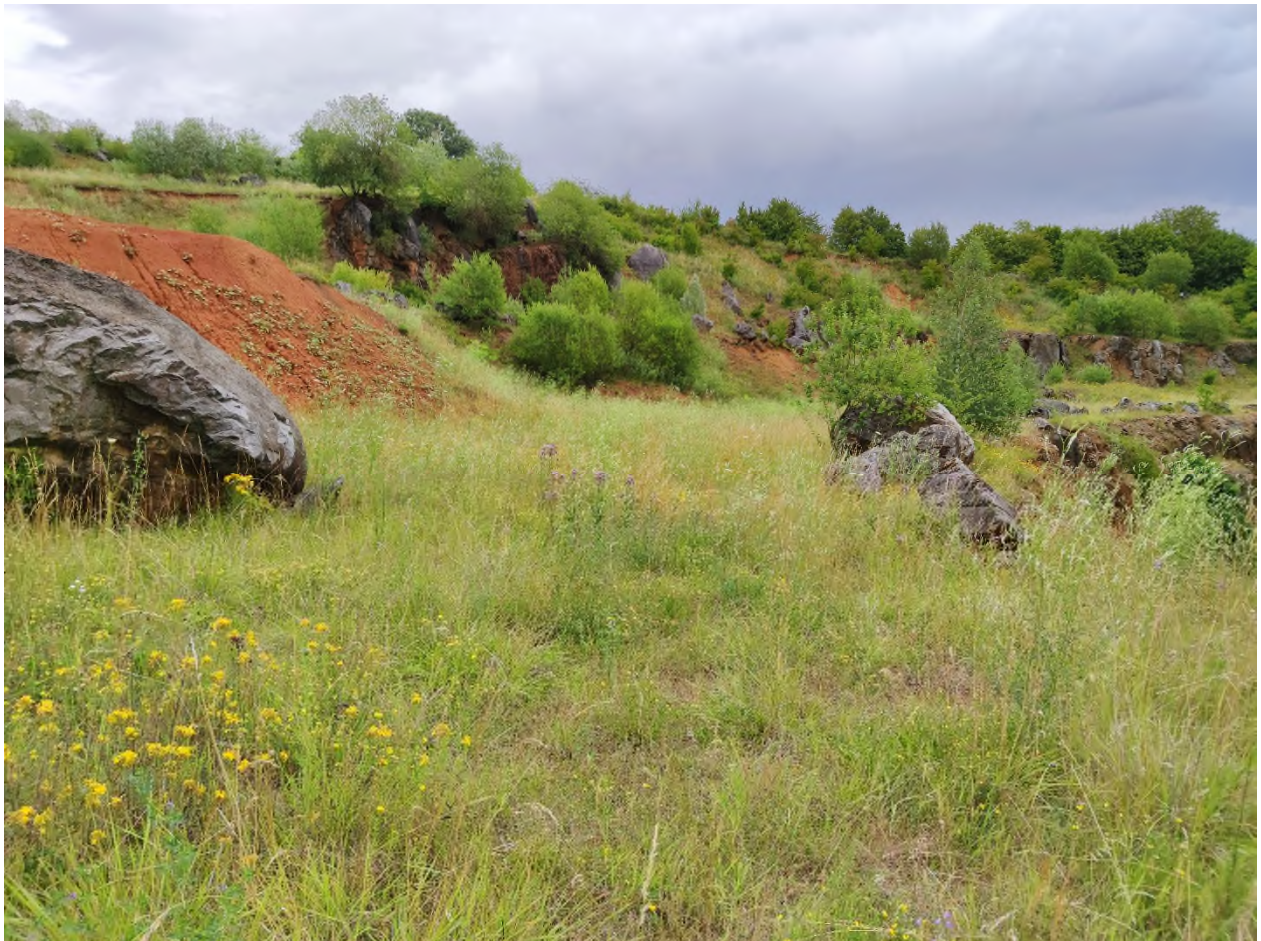
Abbildung 2: Typischer Lebensraum der Zauneidechse bestehend aus einem Mosaik aus vegetationsarmen bis freien Flächen und Gebüsch in ehemaligem Abbaugelände..

Die Zauneidechse ist eine wärmeliebende Art, die halboffene, waldsteppenartige Lebensräume bewohnt. Zur Thermoregulation benötigt sie ein kleinräumiges Aufeinanderfolgen unterschiedlich besonnener Bereiche. Entscheidend ist ein Mosaik aus vegetationsfreien, und vegetationsarmen Strukturen sowie grabbarem Substrat zur Eiablage. Sonnenplätze werden zum „Energietanken“ genutzt und gejagt wird oft im Schatten. Sie ist ein ausgesprochener Kulturfolger und besiedelt eine Vielzahl halboffener Sekundärlebensräume, wie Trockenrasen, Bahndämme und Böschungen, Ruderalflächen, Industrie- und Infrastrukturbrachen, Weinberge, Obstwiesen und Abbaugelände. Die Nahrung der Zauneidechse besteht vor allem aus Insekten und Spinnen. Zauneidechsenweibchen legen nach der Paarung 8-15 Eier in gut grabbare Rohbodenstellen ab, die gut besonnt sind. Nach 8-10 Wochen schlüpfen die Jungtiere.