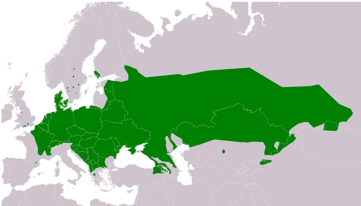
Abbildung 3: Gesamtverbreitung Zauneidechse; Quelle:(IUCN 2018)

Das Gesamtareal der Zauneidechse erstreckt sich von der östlichen Hälfte Frankreichs über ganz Mitteleuropa nördlich der Alpen südwärts bis zum Balkan und ostwärts bis über die nördliche Hälfte Kasachstans bis in die Baikalsee-Region. Im Norden reicht das Vorkommen bis Dänemark. Es gibt einige verinselte Vorkommen in Südengland, den Pyrenäen, Südschweden, und Südfinnland (Blanke 2010, IUCN 2018).