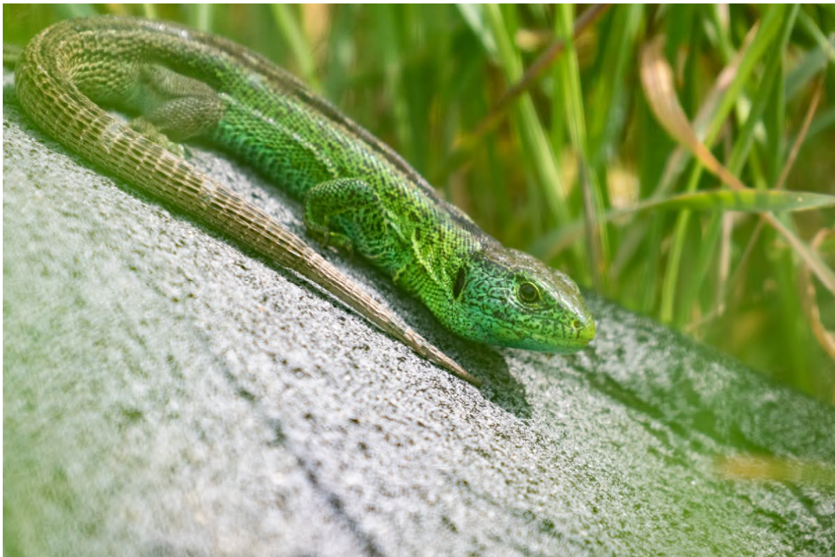
Abbildung 1: Zauneidechsenmännchen beim Sonnenbad auf künstlichem Versteck

Die Zauneidechse ist eine der häufigsten und auffälligsten heimischen Reptilienarten. Sie kann eine Gesamtkörperlänge von 25 cm erreichen, wovon jedoch ca. 60% der Schwanz ausmacht. Die Art zeichnet sich durch einen deutlichen Geschlechtsdimorphismus aus. Die Weibchen sind etwas größer, aber unauffälliger gefärbt. Die Männchen fallen in der Prachtfärbung durch die leuchtend grünen Flanken und Gesichter auf. Die Grundfärbung der Zauneidechse ist braun mit bis zu drei hellen Längstreifen. Weitere artspezifische Merkmale sind der große, stumpfe Kopf und die weißen, schwarz umrandeten Flecken auf Rücken und Flanken.